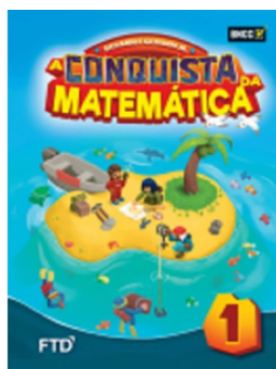
A Conquista da Matemática EDITORA FTD 1º ano