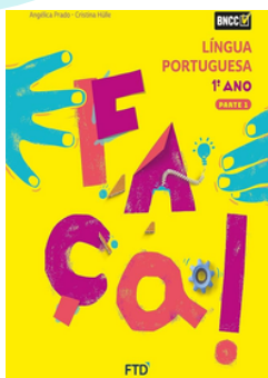
FAÇA Língua Portuguesa EDITORA FTD 1º ano