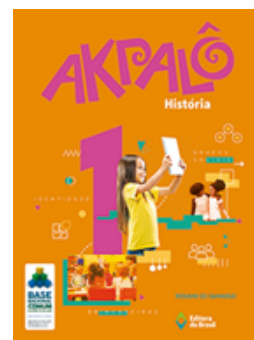
História Coleção Akpalô EDITORA Brasil VOLUME 1