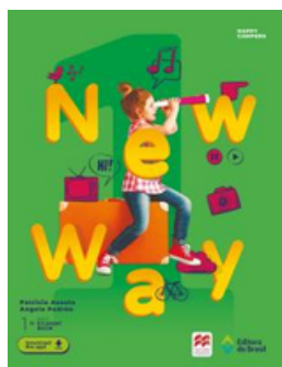
Inglês NEW WAY 1 EDITORA Brasil