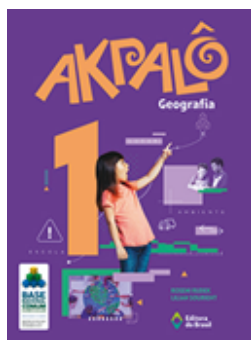
Geografia Coleção Akpalô EDITORA Brasil VOLUME 1