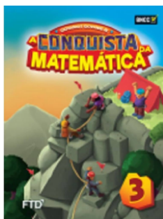
A Conquista da Matemática EDITORA FTD 3º ano