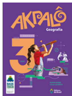
Geografia Coleção Akpalô EDITORA Brasil VOLUME 3