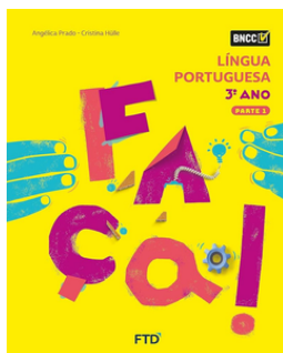
FAÇA Língua Portuguesa EDITORA FTD 3º ano