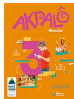
História Coleção Akpalô EDITORA Brasil VOLUME 3