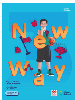
Inglês NEW WAY - 3 EDITORA Brasil

O código Promocional dos livros de Matemática e Português da Editora FTD estará liberado no mês de novembro de 2024.