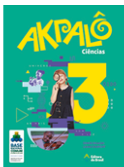
Ciências Coleção Akpalô EDITORA Brasil VOLUME 3