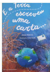
E a Terra Escreveu uma Carta... Autora: Jonas Ribeiro Editora: Melhoramentos