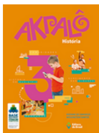
História Coleção Akpalô EDITORA Brasil VOLUME 3