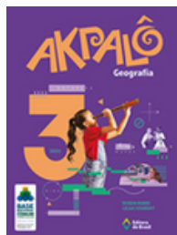
Geografia Coleção Akpalô EDITORA Brasil VOLUME 3