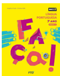
FAÇA Língua Portuguesa EDITORA FTD 3º ano