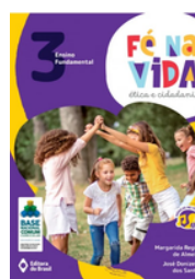
Ética e cidadania Fé Na Vida EDITORA Brasil VOLUME 3