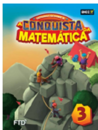
A Conquista da Matemática EDITORA FTD 3º ano