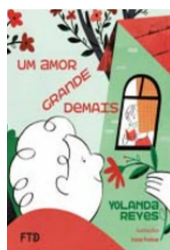
Um amor grande demaís Autora: Yolanda Reyes Editora: FTD