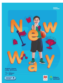
Inglês NEW WAY 3 EDITORA Brasil