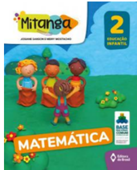
PROJETO MITANGA MATEMÁTICA VOLUME 2