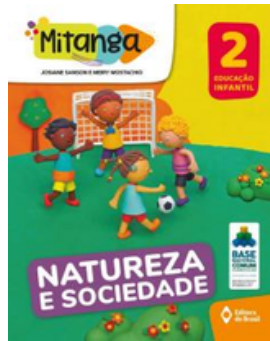
PROJETO MITANGA NATUREZA E SOCIEDADE VOLUME 2