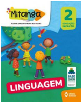
PROJETO MITANGA LINGUAGENS VOLUME 2