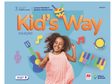
LIVRO KID'S WAY - VOLUME 3