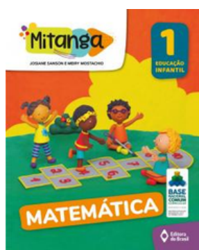
PROJETO MITANGA MATEMÁTICA VOLUME 1