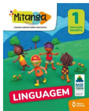
PROJETO MITANGA LINGUAGENS VOLUME 1