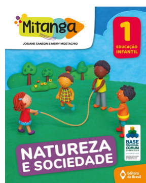
PROJETO MITANGA NATUREZA E SOCIEDADE VOLUME 1