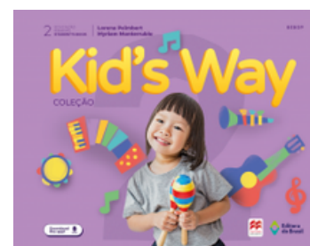
KID'S WAY - VOLUME 2