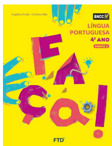
FAÇA Língua Portuguesa EDITORA FTD 4º ano