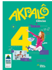
Ciências Coleção Akpalô EDITORA Brasil VOLUME 4