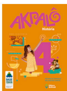
História Coleção Akpalô EDITORA Brasil VOLUME 4