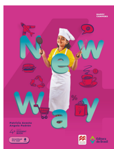
Inglês NEW WAY 4 EDITORA Brasil