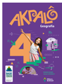
Geografia Coleção Akpalô EDITORA Brasil VOLUME 4