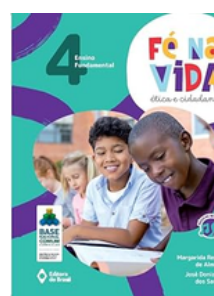
Ética e cidadania Fé Na Vida EDITORA Brasil VOLUME 4