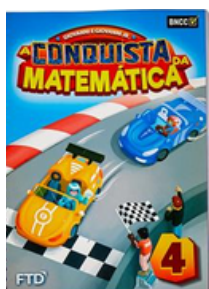
A Conquista da Matemática EDITORA FTD 4º ano