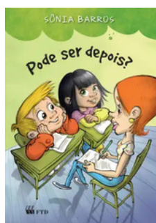
Pode ser depois? Autora: Sônia Barros Editora FTD