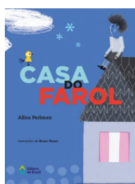
CASA DO FAROL Autora: Eliana Perlman Editora do Brasil