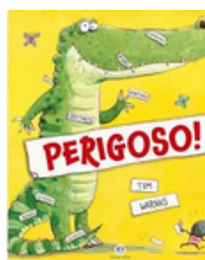
Título: Perigoso! Autor: Tim Warnes Editora: Ciranda Cultural