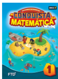
A Conquista da Matemática EDITORA FTD 1º ano