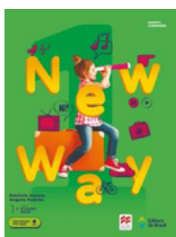
Inglês NEW WAY 1 EDITORA Brasil