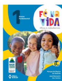
Ética e cidadania Fé Na Vida EDITORA Brasil VOLUME 1