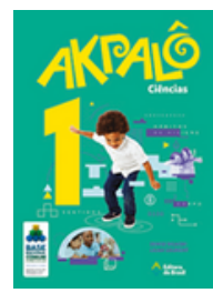
Ciências Coleção Akpalô EDITORA Brasil VOLUME 1