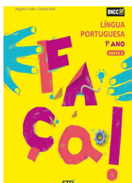
FAÇA Língua Portuguesa EDITORA FTD 1º ano