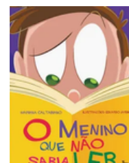
Título: O Menino que Não Sabia Ler Autora: Mariana Caltabiano Ilustrações: Eduardo Jardim Editora: Trix