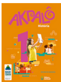
História Coleção Akpalô EDITORA Brasil VOLUME 1