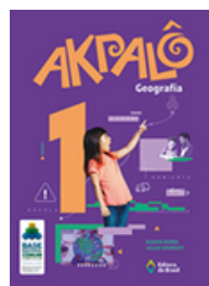
Geografia Coleção Akpalô EDITORA Brasil VOLUME 1